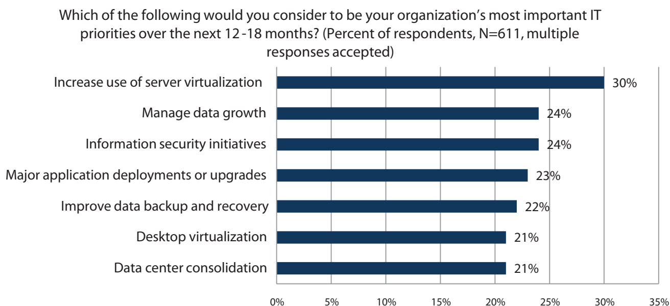
Abbildung 1: Wichtigste IT-Initiativen für 2011

In den letzten Jahren gab es in der IT-Infrastruktur tiefgreifende Änderungen, und es wird zunehmend konsolidiert: zuerst in große Datenzentren und anschließend auf virtuellen Servern, die sich auf physischen Systemen befinden. Warum findet diese Aggregation statt? IT-Manager wünschen mehr Kontrolle über Anlagewerte sowie Kostenersparnisse bei IT-Vorgängen. Dieser Wunsch nach mehr Kontrolle über Anlagewerte und IT-Vorgänge sticht bei der ESG-Untersuchung deutlich heraus: 1 IT-Fachleute haben „mehr Nutzung von Servervirtualisierung“, „Datenzunahme verwalten“ und „Konsolidierung von Datenzentren“ als höchste IT-Prioritäten für die nächsten 12 bis 18 Monate bewertet (siehe Abbildung 1).